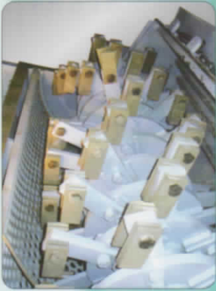
スイングハンマー部分